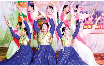
हरिभूमि न्यूज | आगर मालवा